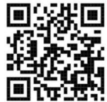
Video complet de la ponència